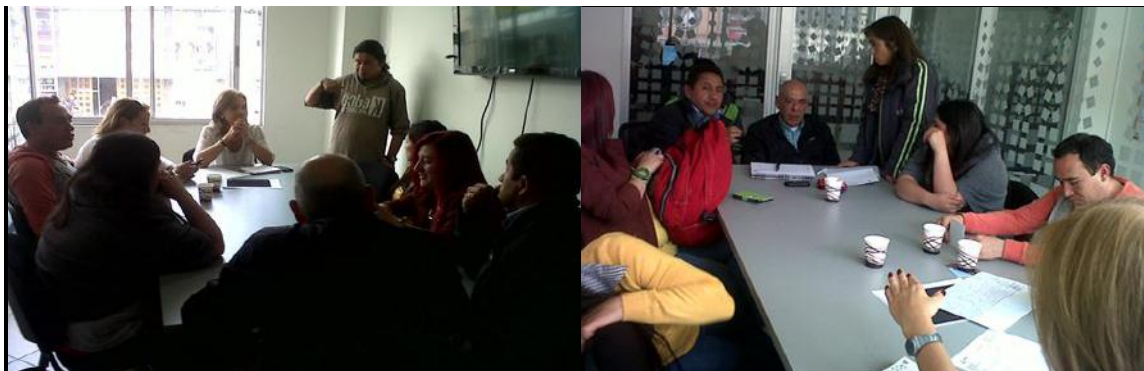
Reunión preparatoria en sede alterna de la Veeduría Distrital para intervención en Calle 40 sur