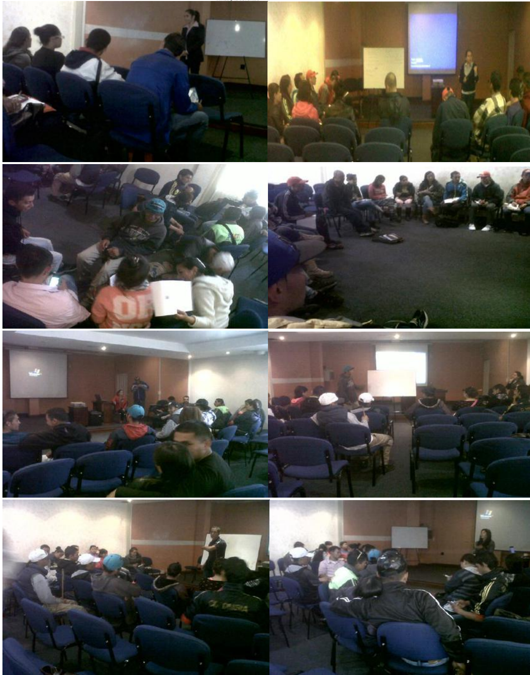
Evidencia fotográfica de la formación con Veeduría Distrital en el primer semestre 2015