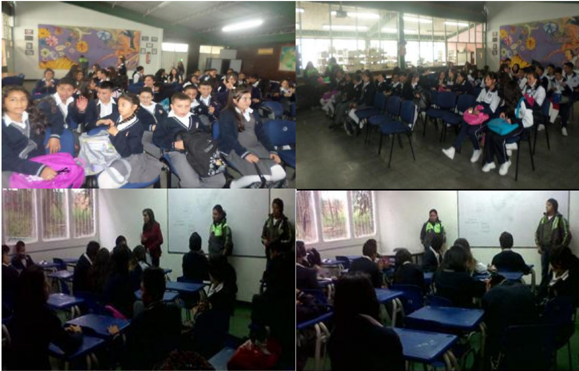
Socialización de la propuesta de cambio cultural a los estudiantes del Colegio Restrepo Millán

la estación 40 sur de Transmilenio. En dicha intervención se tuvo apoyo de las y los estudiantes del Colegio Restrepo Millan, Secretaria de movilidad y policía de Transmilenio. Liderado por las y los gestores de Misión Bogotá y la Oficina Asesora de Planeación, como se evidencia a continuación: