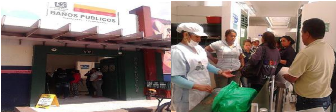
Evidencia fotográfica del Grupo Veedor IDIPRON, en recorrido por baños públicos