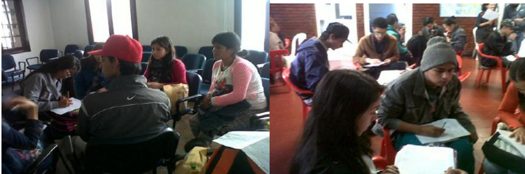
Participación de integrantes del Grupo Veedor en encuentro con Cabildantes y Paz Social Distrital