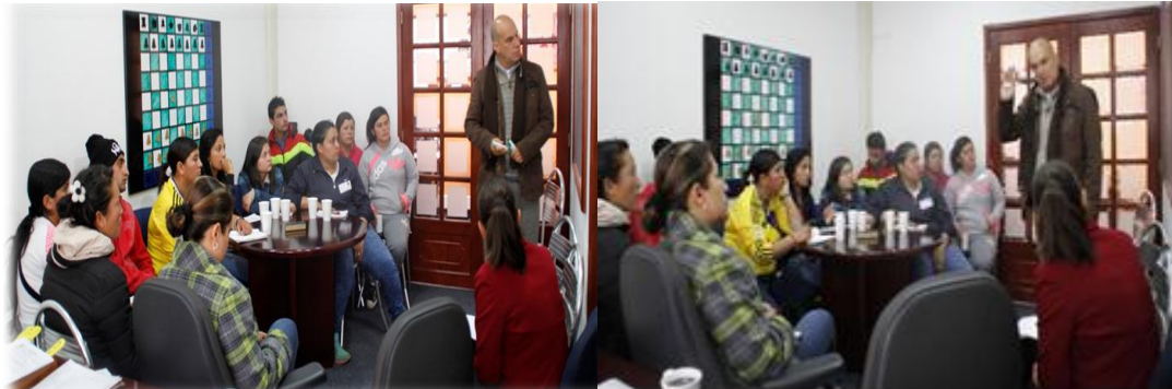
El director realiza formación al Grupo Veedor sobre el contrato 1317