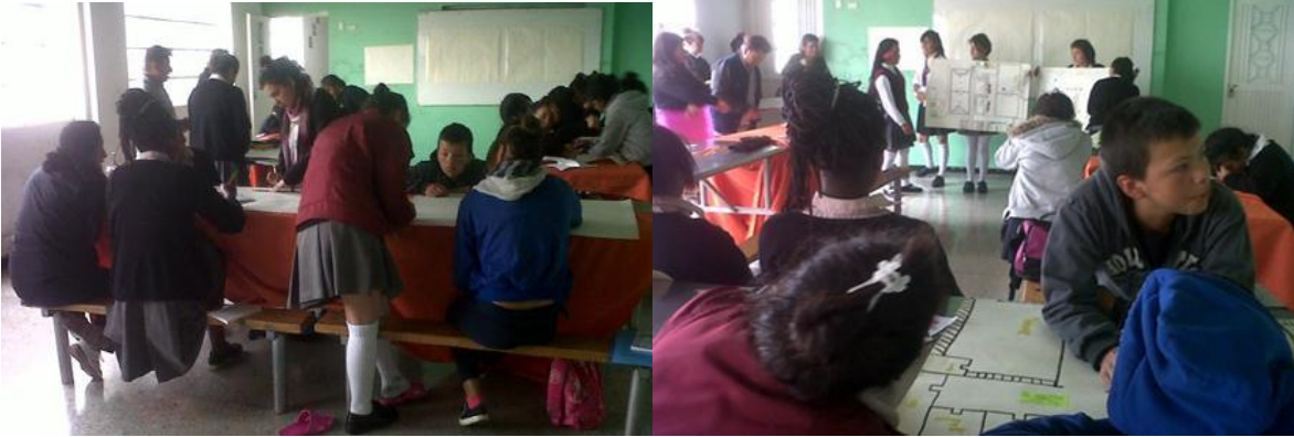
Formación en UPI La 27

educadores y estudiantes para ajustar los tiempos de las visitas en cada una de las Unidades de protección integral.