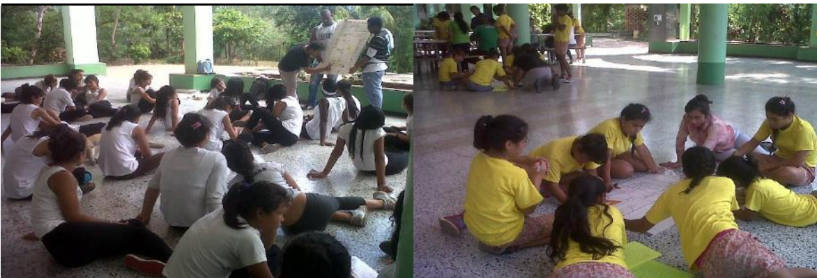
Formación en UPI La Vega