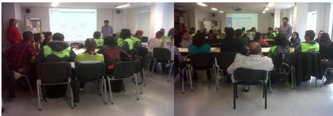
Formación Misión Bogotá en la Veeduría Distrital

También la regulación propia y la regulación mutua, la capacidad de concertar, cumplir y reparar acuerdos, la promoción de prácticas de control social sobre la gestión pública, y la instauración y la actuación en concordancia con normas informales que consoliden la confianza y el sentido de pertenencia.