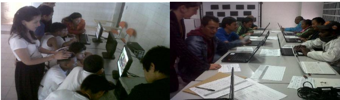
Socialización de las piezas trans media y productos pedagógicos a estudiantes y educadores de las Unidades

Este proceso se acordó con la responsable de la Escuela popular Itinerante para ser instalados en el Aula Movil y con la rectora del Colegio IDIPRON para ser socializados en varias Unidades de Protección Integral y así queden como herramienta que pueda ser utilizada por la Escuela Pedagógica Integral y en otros escenarios que el proyecto pedagógico considere pertinentes. En primer lugar se instalaron en el Aula Movil en la cual han sido socializados a grupos de visitantes de esta y también se pretende hacer capacitaciones continuas a las y los educadores.