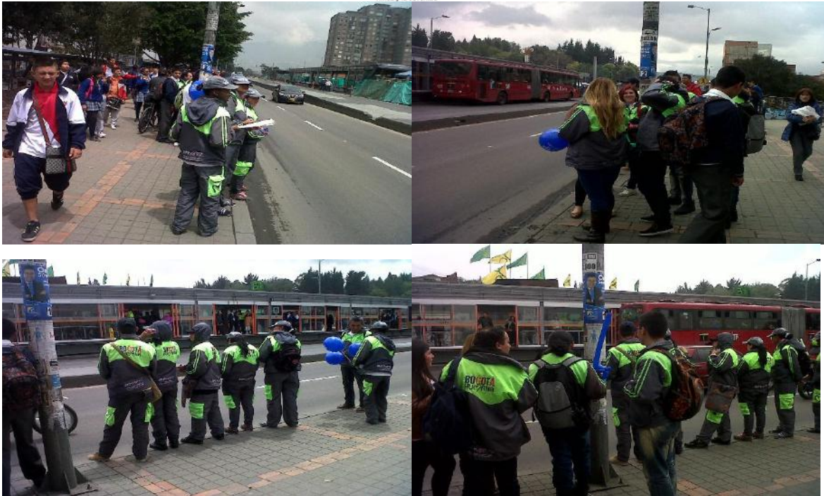
Intervención en Estación calle 40 sur