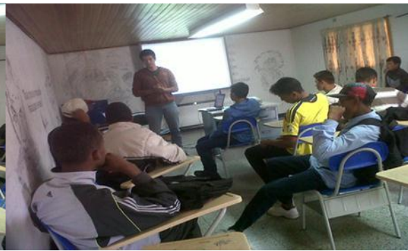
Formación en UPI La Florida