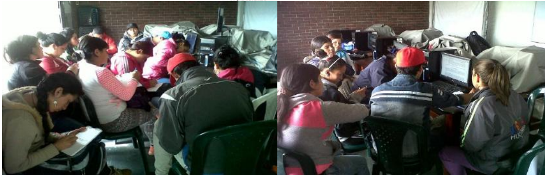
Socialización del contrato 1317 al cual el Grupo Veedor realizará el ejercicio de control social