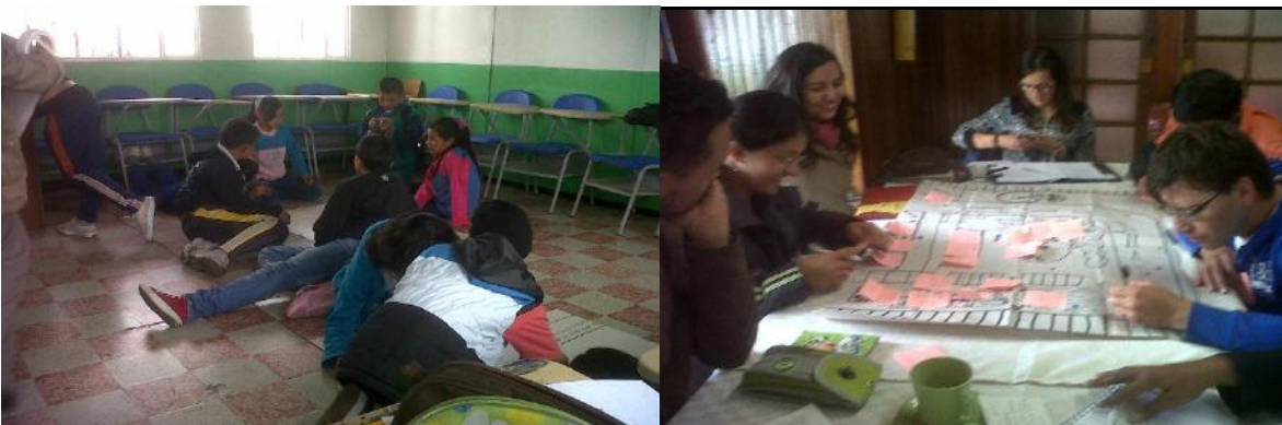
Formación en UPI La Arcadia