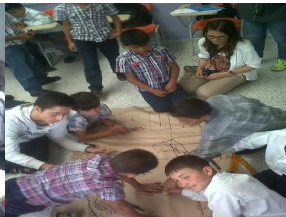
Formación en UPI San Francisco