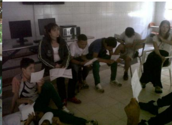
Formación en UPI El Edén